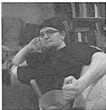
Nimi: Kraldo Hallituspesti: Isäntä Mikä saa sinut jatkamaan osakunnassa? Skoimistojatkot, osakuntalaiset, VPK, kaiken- näköinen. What makes you tick? Before I leave, brush my teeth with a bottle of Jack 'Cause when I leave for the night, I ain't com- ing back Tick Tock on the clock